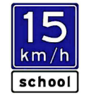
Ondersteunende bebording Nader te bepalen