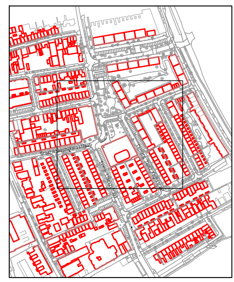
Situatie Schaal 1:2000