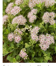
Spiraea japonica 'Nana'