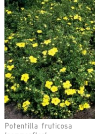
Potentilla fruticosa 'Sommerflor'