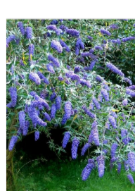
Buddleja x 'Blue Chip'