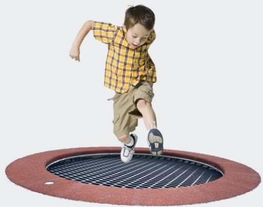
RONDE TRAMPOLINE DIAMETER 2 M.