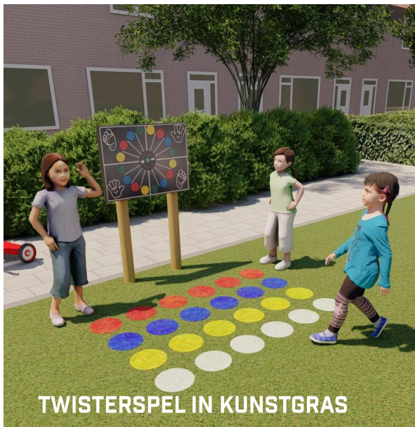
TWISTERSPEL IN KUNSTGRAS