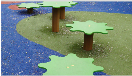
9. Jobllebollen, 45cm heel (4x), 45cm half (2x)