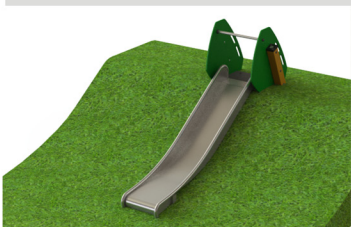
6. AKA-K.0 Flex Slide 100 talud