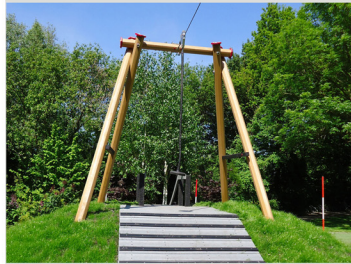
3. AEKH-Z.3 Bird Hopper