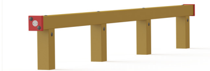
8. FAKU.0 Stap Step (3x)