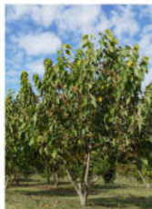
Tilia lanuginosa mercurialis